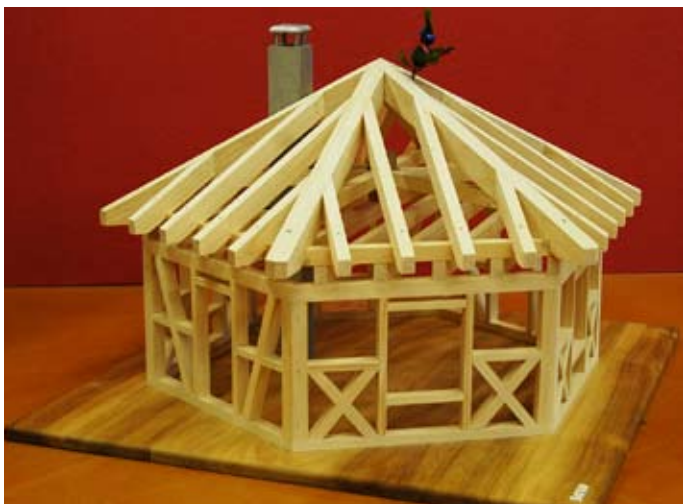
Bestplatziertes Modell bei den freien Modellen.